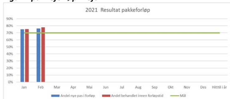
Figur 1 pakkeforløp kreft

I februar fikk 78 % av kreftpasientene behandling innen anbefalt forløpstid.