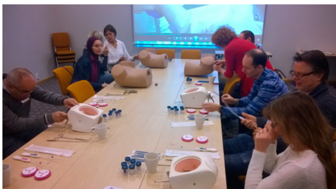
Bilder fra noen av stasjonene

75 fastleger deltok på Vår møtet på Quality Hotell på Grålum 11. og 12. mars.